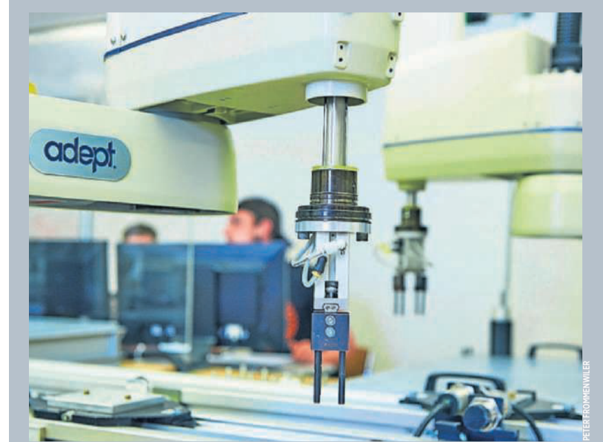
Adept: Dieser Roboter von Omron Adept Technologies ist kein abgespecktes Schulgerät, sondern steht genau so auch in Unternehmen in der Produktion.

In den letzten Jahren hat auch der Bund die Wichtigkeit der Höheren Berufsbildung für die Schweizer Wirtschaft erkannt und 2013 ein Strategieprojekt zu